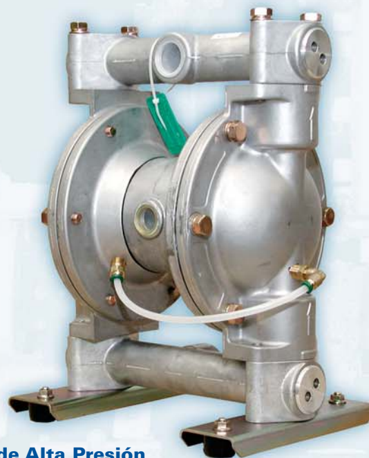
Bomba de Alta Presión Relación 2:1

Instalación: No se requieren costosas válvulas o sistemas de alivio de presión. Gran retención de presión.